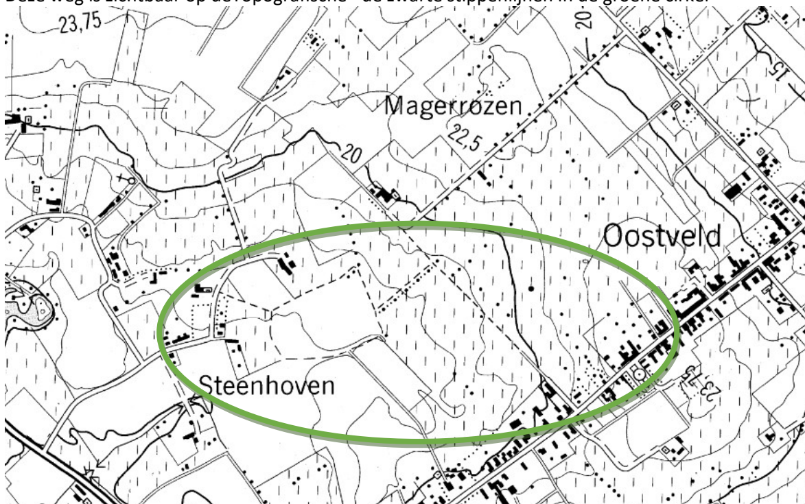
Figuur 1: zwart-wit Topografische kaart van 1977

Deze weg is zichtbaar op de Topografische= de zwarte stippenlijnen in de groene cirkel