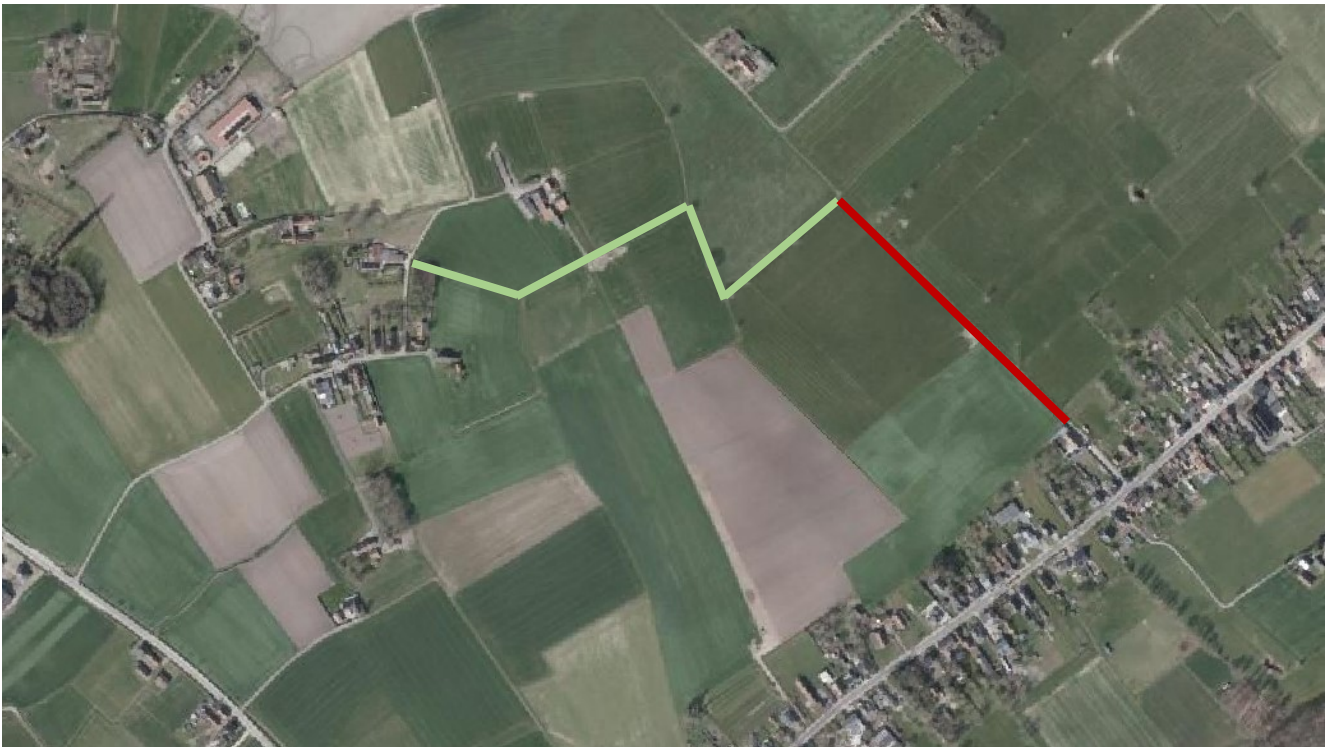
Figuur 2: luchtfoto Vlaanderen 2021

De gewenste verbinding wordt gerealiseerd ten voordele van de voetgangers en fietsers. Er zal géén gemotoriseerd verkeer mogelijk zijn (lichtgroene verbinding op figuur 2) met uitzondering van de huidige bestaande weg vanaf de parochiezaal richting Magerrozen (rode verbinding op figuur 2) waar plaatselijk verkeer voor aangelanden (landerijen) mogelijk moet blijven. Dit weggedeelte is voor gemotoriseerd verkeer wel doodlopend.